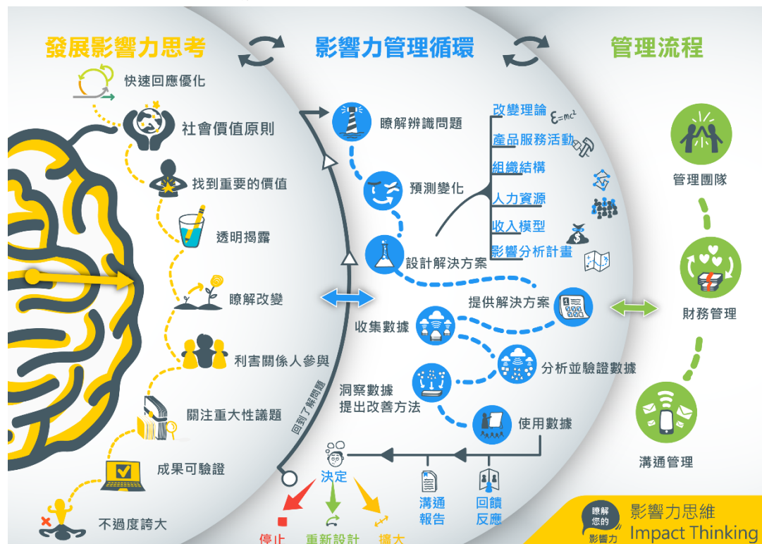
圖 1 影響力思維與管理概念圖(The impact thinking approach was developed within “Know Your Impact: Social Impact Management Tools for Young Social

因此，國立臺中教育大學管理學院社會企業中心(以下簡稱本中心)為落實永續發展目標，因應產業時代潮流需求，扶植永續創業及社會創新提案團隊，提出「Maximize Your Impact - 影響力生態圈徵集計畫」，一方面鎖定社會企業、新創團隊及非營利組織之公益或社會創新專案，導入影響力衡量與管理 (Impact Measurement & Management, IMM) 思維(圖 1)，促使團隊在整體資源的配置及應用上，能夠精準對焦企業 ESG 或善盡社會責任之公益需求，另外一方面，透過專業及透明之影響力展現，創造企業在邁向永續轉型及公益推動，能夠有效責信及管理，以建立台灣影響力團隊共好生態圈。